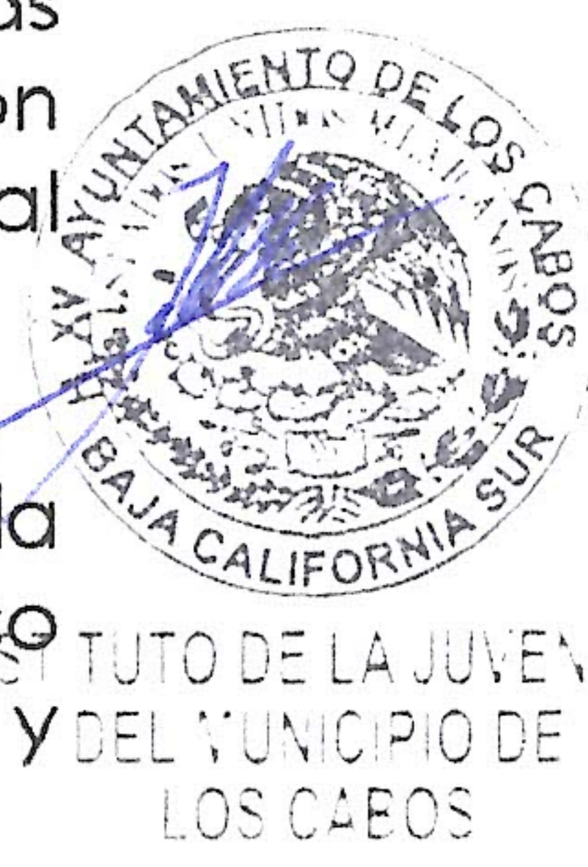
Tabla de metas elaborada por el IMPLAM para el PDM correspondiente al (INJUVE)

Estamos trabajando con enfoque transversal y colaborativo, fortaleciendo la transparencia y la rendición de cuentas. Este informe forma parte del compromiso con el Observatorio Ciudadano , que nos permite dar seguimiento, evaluar y mejorar continuamente el impacto de nuestras políticas públicas juveniles.